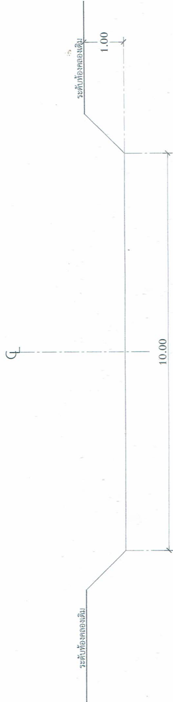
แบบขยาย ชุดลอกปากคลองทุ่งน้อย SCALE 1 : 25